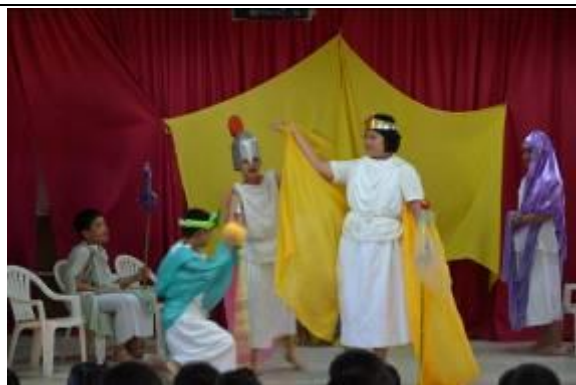
五年級希臘神話-金蘋果劇照-1