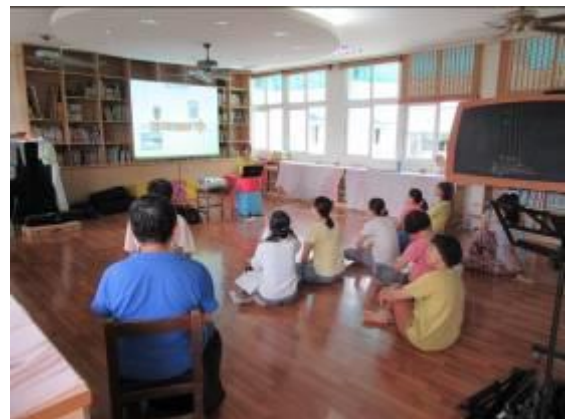
教師戲劇課程研習