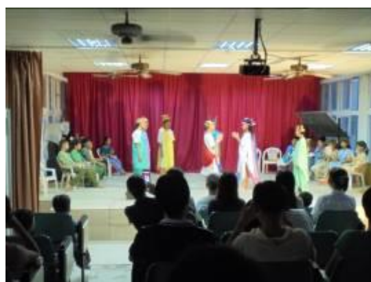
四年級北歐神話-索爾借酒缸劇照-2