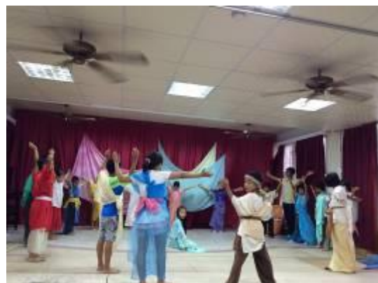
二年級林默娘劇照-2