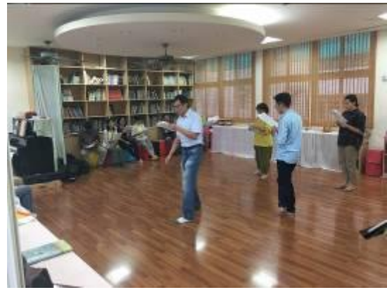
教師戲劇課程體驗-分配角色念台詞