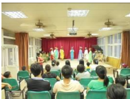
四年級北歐神話-索爾借酒缸劇照-1