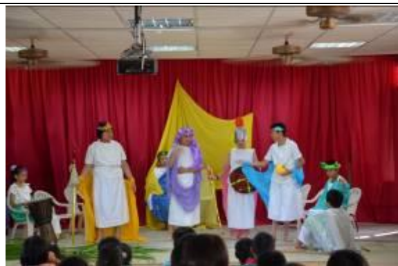
五年級希臘神話-金蘋果劇照-2