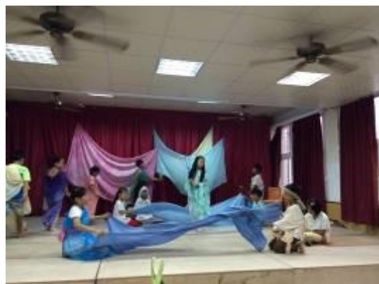
二年級林默娘劇照-1