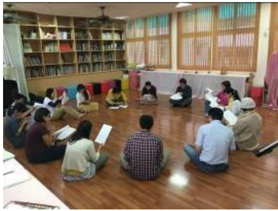
教師戲劇課程體驗-一起念劇本