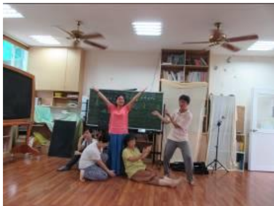
教師戲劇課程體驗-肢體開發