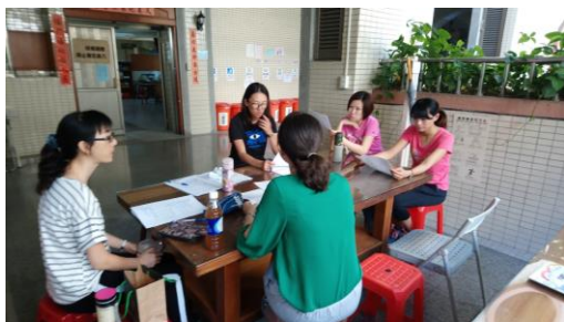
健康與教育科說課