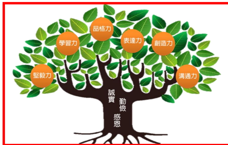
國立北港高級中學學生圖像

本校以十二年國民基本教育願景為前提，並配合新課綱，希望能建立我國「國民核心素養」，本校將優質化發展短程目標為建立學生三品「誠實、勤儉、感恩」、發展六力-「堅毅力、學習力、品格力、表達力、創造力、溝通力」，以使達到多維面向；中程目標為產生三好-「心地好、行為好、氣質好」，進一步達成「豐富學識、培養態度、開拓視野、人文關懷」，使能發展國民核心素養九軸內容，使學生能夠活用知識與能力、並能合作協商、接納多元。