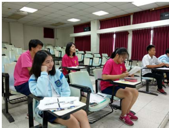
第二外語-西班牙語