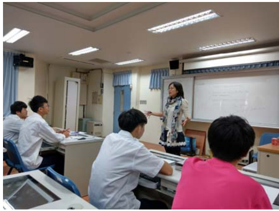
和阿兜仔 show 宜蘭 FunEnglish