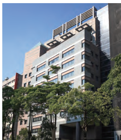
臺北院區 106011 臺北市大安區和平東路一段179號