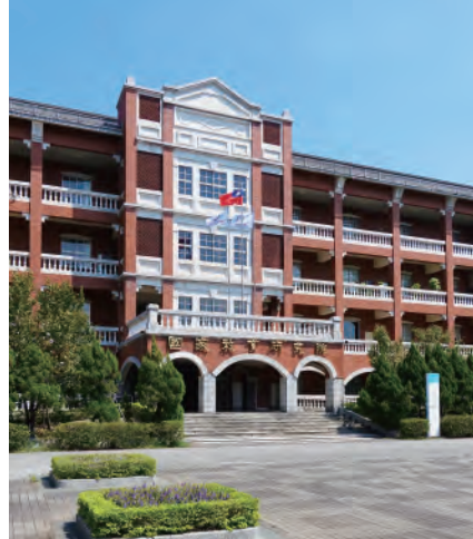
三峽總院區 237201 新北市三峽區三樹路2號