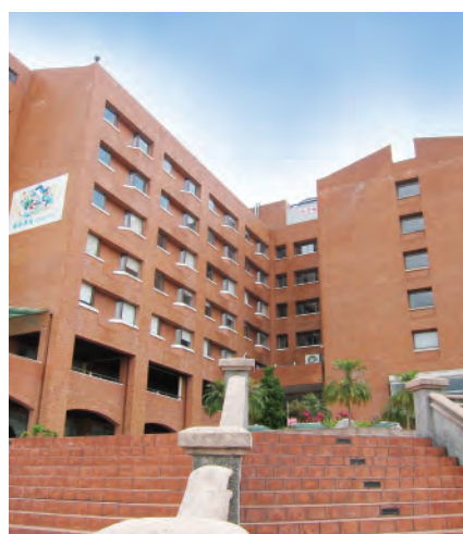
中部辦公室 420081 臺中市豐原區師範街67號