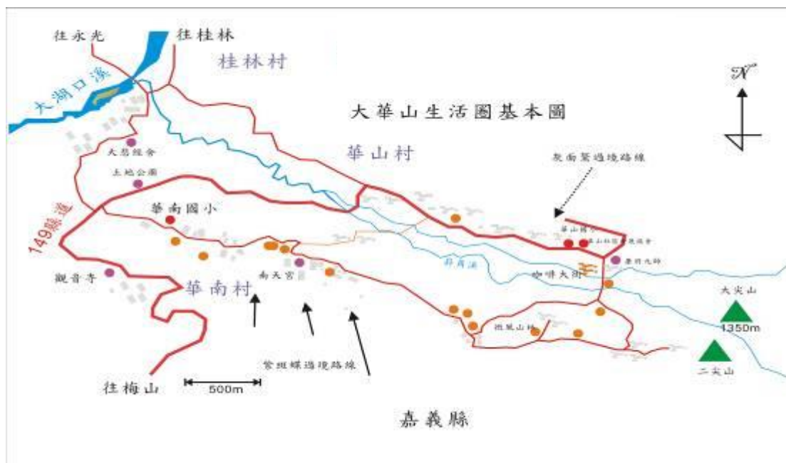
圖二：大華山地區生活圈基本圖

大華山部落(華山、華南)位在古坑山系的邊緣，處於古坑鄉東南隅。東與梅山鄉為界，西鄰炭腳村南接梅山北與永光村銜接。計畫區域位於海拔 100 公尺至 800 公尺之間，是部落星散之僻遠山村，惟社區內道路四通八達，尚稱方便。居民多以務農為業，區域內栽植有椪柑、咖啡、麻竹、鳳梨、茶、檳榔、山蘇、蘭花等作物，相對於華山地區咖啡餐廳林立，靠近華南地區仍保有較為純樸的感覺。