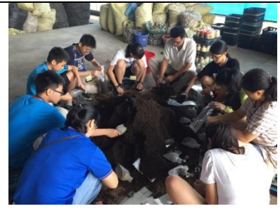
學生透過進行服務學習，實際參與活動感受

除了學校四季課程發展外，學校針對教師增能與教學創新的推動也不遺餘力。為了進行相關課程領導，由校長與教務主任進行公開觀課示範，並鼓勵相關同仁進行教學創新，讓孩子在學校內部有更多的學習體驗。