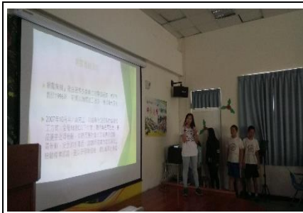
師生共同規劃自主服務旅行計畫，並且進行計畫審查報告