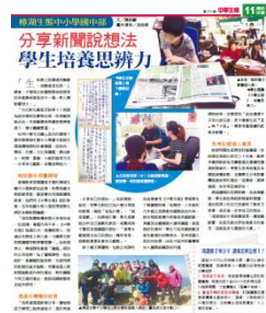
結合班級讀報，進行議題探討課程

如本校著重生態議題探討，便結合中學生報讀報計畫進行新聞議題討論。學科課程除利用相關實物、實驗進行操作，也能連結社區在地產業，進行專題研究。