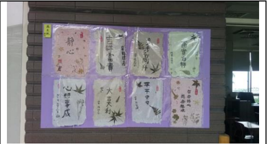
學生手造紙創作課程

夏季課程則是以自主服務課程為主，教師社群間分享與學生共同討論而發展出一個具有共識的課程主題，由教師帶領學生進行課程學習與引導，讓班級產生主動學習與服務的氛圍。教師在此時期對於課程願景、課程轉化與社群經營技巧上較有經驗，因此學生對於校訂課程執行有想法或是不同見解，教師有較高的能力與素養面對，因此教師社群成員開始在個小組中扮演主導者的角色，協助每個小組開始去尋找出自己的主題與方向，一起去完成一個新的嘗試與課程發展，讓師生共學成長，也讓教師社群的力量擴散整合學生，達成學校每一個人都是整合型校訂課程發展與創造的一份子。