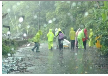
學生自主前往服務，隨隊老師負責記錄、觀察