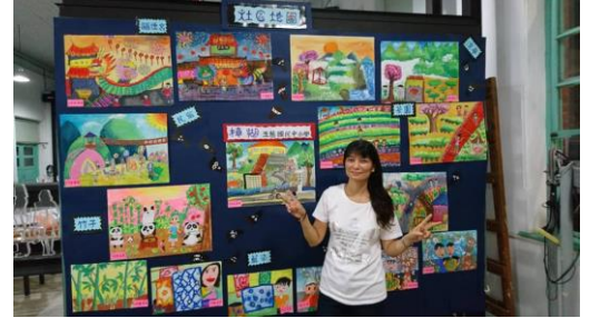
學生畫我家鄉成果發表