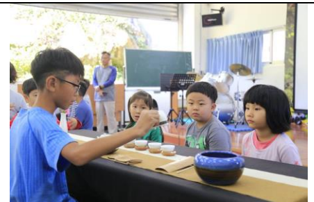
學生茶藝展演與體驗