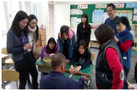
週三進修教師對話