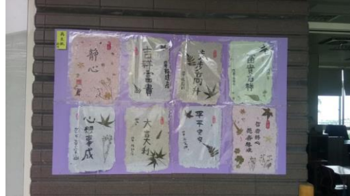
學生手造紙創作課程