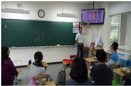
校長課程理念與發展說明

針對學生運鏡、剪輯、腳本等專業指導，學校透過專業講師、共同上課的方式，為教師與學生增能。在透過各班小組對話的方式，自行設定主題、取材、攝影，以完成小組作品。從研究中發現，教師與學生多能從中發展自己較有興趣、熟悉的課程，進行專題探究。在課程內容的設計上有較高的動機，也能引發學生高度的興趣。例如學生選擇樂樂棒球為主題，紀錄彼此的練習過程，不僅是為了自己的青春留下紀錄，也從中凝聚的團隊意識，讓師生間能藉由記錄片的拍攝建立課程的共好而激發出不同的亮點。