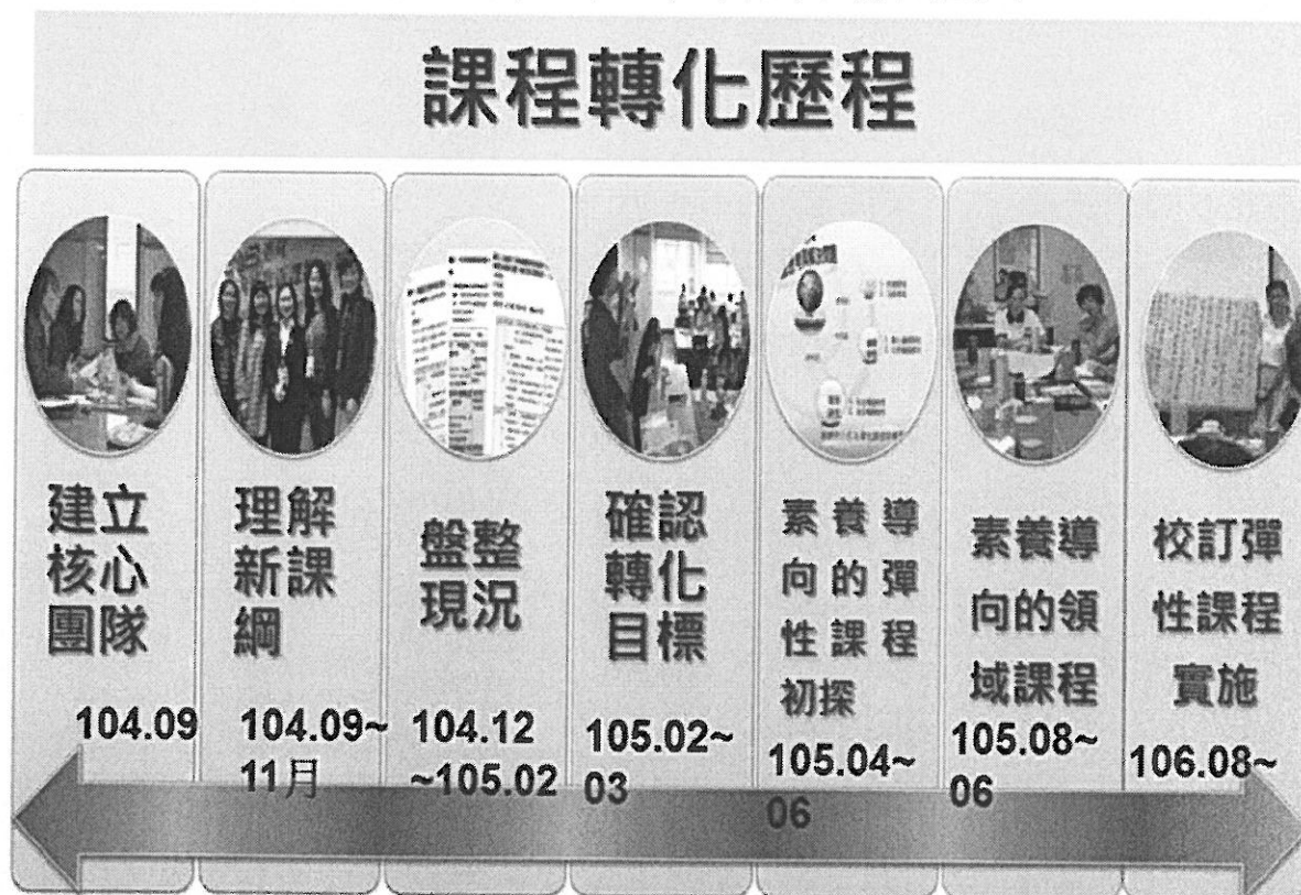
圖一：東華附小十二年國教課程轉化歷程

東華附小今年已經是參與十二年國教課程計畫前導學校的第四年，自 106 學年度以來我們即以十二年國教課綱進行排課，全面試辦。今年是以十二年國教課綱進行排課的第二年。下圖是我們學校十二年國教課程轉化歷程：